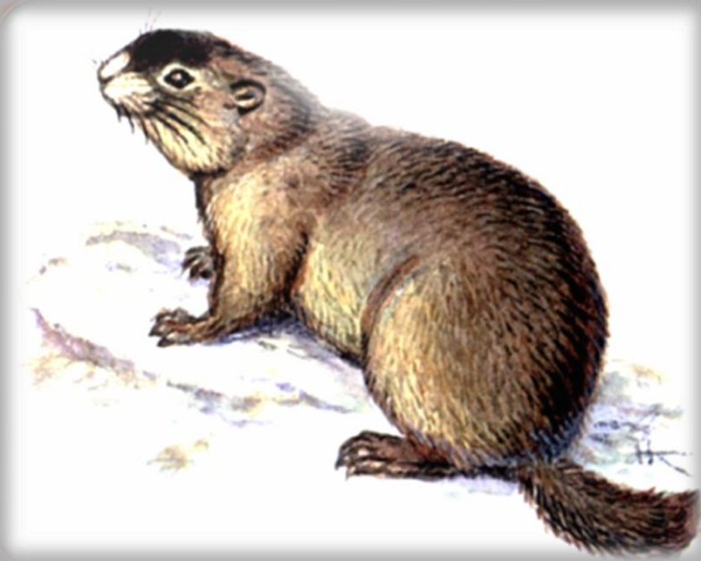
Прибайкальский черношапочный сурок