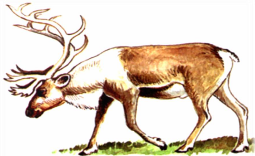
Северный олень (лесной подвид)